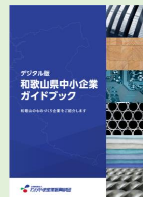
和歌山県中小企業WEBガイドブック